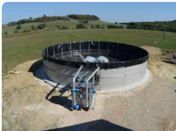
3ème jour : achèvement des travaux pour la technique