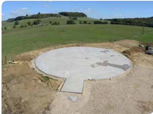
1er jour : dalle préfabriquée réalisée par le maître d'ouvrage