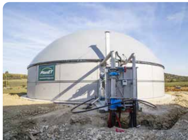
7ème jour : montage et mise en service du toit avec collecteur biogaz. Entre-temps, le réseau d'approvisionnement a déjà été posé.