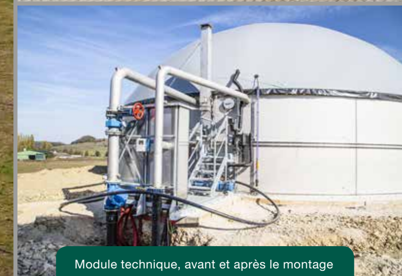
Module technique, avant et après le montage