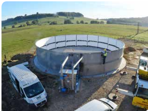
20h : les éléments latéraux sont montés