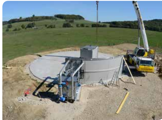
Midi : mise en place du module technique et des premiers éléments latéraux