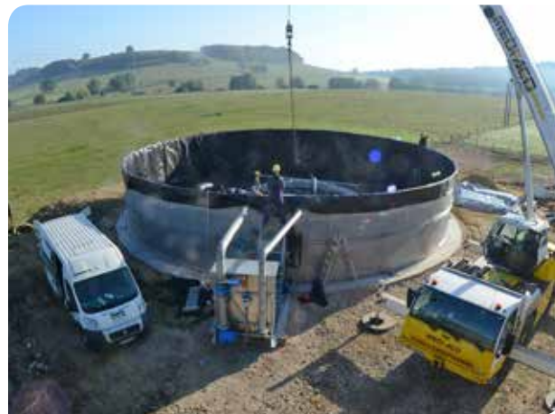
2ème jour : revêtement intérieur du réservoir