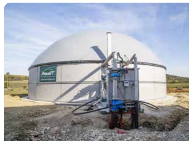
7. Tag: Montage und Inbetriebnahme des Tragluftdaches mit Gasspeicher. In der Zwischenzeit wurden bereits die Versorgungsleitungen gelegt.